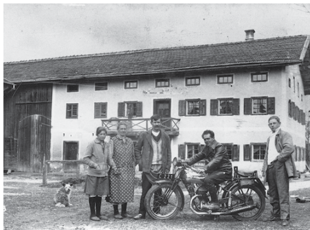
Franz Jägerstätter avec sa moto

n'est pas représenté à son avantage, distant et fuyant. Le renvoi à l'autorité légitime et aux ordres reçus est, en effet, une constante des institutions face aux consciences individuelles ; mais elle pose très exactement le problème de l'objection.