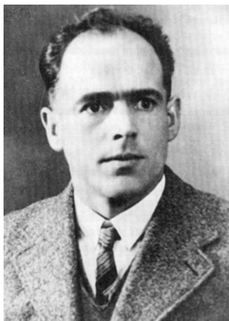
Franz Jägerstätter (9 mai 1907 - 9 août 1943)

Merci à Terrence Malick d'avoir porté à l'écran ce que fut l'objection de conscience héroïque de Franz Jägerstätter !